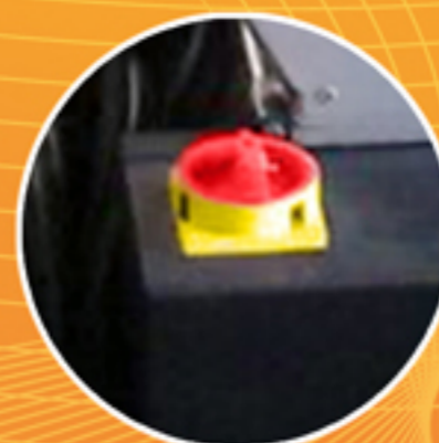
Botão de Emergência