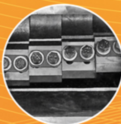
Jogo de facas