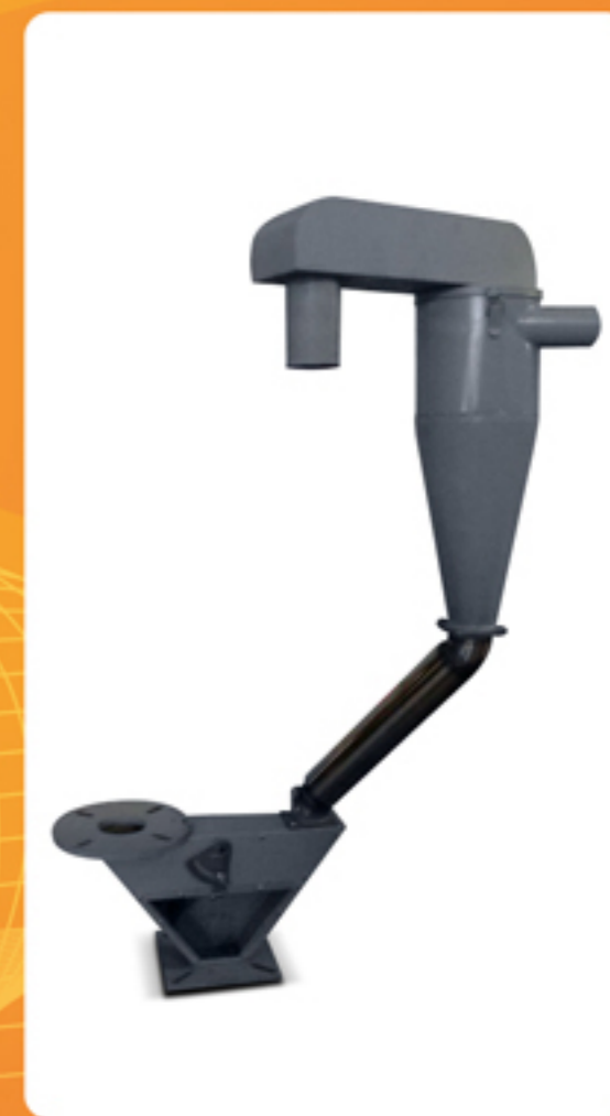
Válvula de Mistura Proporcional